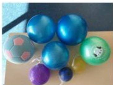
100円均一ショップで入手できるソフトボール (80-130 g)