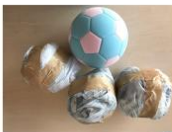
小学校体育サポートで推奨のスポンジボール (200-230 g) および新聞ボール